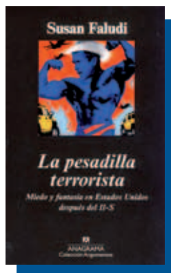
Susan Faludi La pesadilla terrorista

Tras la presentación del objeto de estudio —la crisis— y la ampliación del campo de batalla más allá del contexto económico, Gil Calvo nos da las coordenadas del mapa, los factores causales de la crisis —las redes sociales, las redes mediáticas y las autoridades públicas—, y nos explica el porqué de sus relaciones. Después de analizar el flujo de mensajes que circula por las redes mediáticas y su desplazamiento del presente a la «inducción de expectativas de futuro», le toca el turno a la redefinición de crisis como «ruptura de la continuidad temporal», necesario para que el poder político lo pueda utilizar a su antojo. ¿Cómo? Apoderándose del poder simbólico, el mismo que manejan medios de comunicación y autoridades públicas. La crisis sistémica como coartada de un gran fraude. ¿El pronóstico de este sociólogo? Aunque no lo crean, esperanzador.