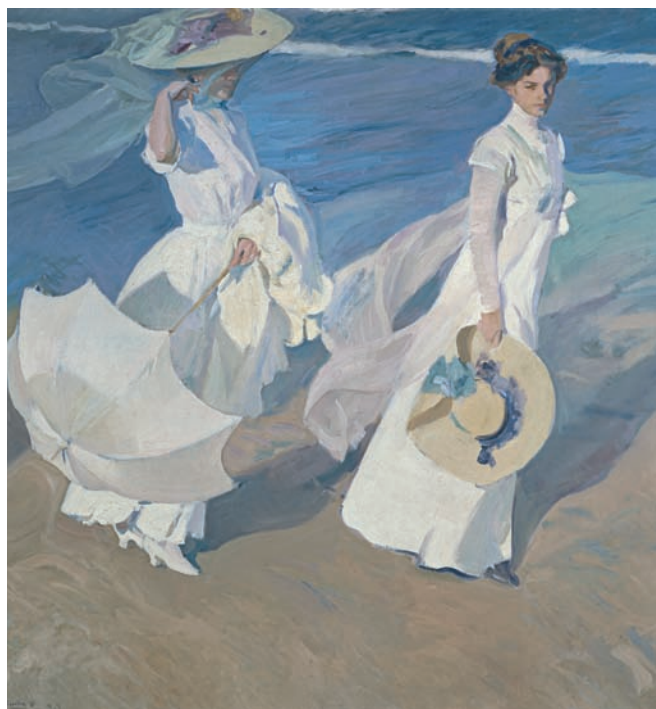
Paseo a la orilla del mar (1909).