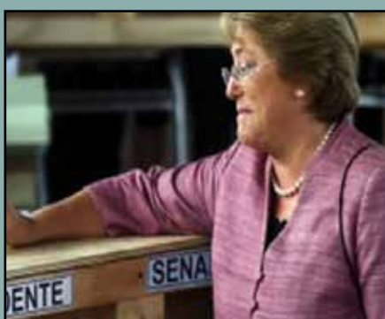
presidenta, femenino correcto

Magnificar significa 'ensalzar, alabar, engrandecer' y también, según diccionarios de uso como el Vox, 'hacer que una cosa parezca más grande o grave de lo que es'. Así, son adecuadas frases como «Según la congresista, se quieren magnificar unas declaraciones y generar una ola de odio», donde magnificar equivale a exagerar . Sin embargo, en noticias sobre accidentes o catástrofes, se emplea en ocasiones para decir que están adquiriendo dimensiones mayores de lo esperadas: «El accidente se está magnificando» o «Según pasan las horas, se magnifica la catástrofe». En estos casos, lo apropiado habría sido escribir, por ejemplo, «El accidente está adquiriendo mayores dimensiones» y «Según pasan las horas, se agrava la catástrofe», pues el uso de magnificar da a entender que se está exagerando la gravedad, cuando lo que se pretende expresar es que las consecuencias están siendo, de hecho y realmente, peores de lo previsto. Por otra parte, probablemente por influencia del inglés to magnify , en informática, óptica y otras disciplinas, es muy habitual emplear magnificar , sin que pueda considerarse censurable debido a su extendido uso, en frases como «Al magnificar su rostro (una o dos veces según la distancia), se refleja menos luz en la pantalla», donde, en cualquier caso, habría sido preferible escribir ampliar o agrandar .