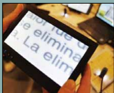
Magnificar, uso adecuado

Magnificar significa 'ensalzar, alabar, engrandecer' y también, según diccionarios de uso como el Vox, 'hacer que una cosa parezca más grande o grave de lo que es'. Así, son adecuadas frases como «Según la congresista, se quieren magnificar unas declaraciones y generar una ola de odio», donde magnificar equivale a exagerar . Sin embargo, en noticias sobre accidentes o catástrofes, se emplea en ocasiones para decir que están adquiriendo dimensiones mayores de lo esperadas: «El accidente se está magnificando» o «Según pasan las horas, se magnifica la catástrofe». En estos casos, lo apropiado habría sido escribir, por ejemplo, «El accidente está adquiriendo mayores dimensiones» y «Según pasan las horas, se agrava la catástrofe», pues el uso de magnificar da a entender que se está exagerando la gravedad, cuando lo que se pretende expresar es que las consecuencias están siendo, de hecho y realmente, peores de lo previsto. Por otra parte, probablemente por influencia del inglés to magnify , en informática, óptica y otras disciplinas, es muy habitual emplear magnificar , sin que pueda considerarse censurable debido a su extendido uso, en frases como «Al magnificar su rostro (una o dos veces según la distancia), se refleja menos luz en la pantalla», donde, en cualquier caso, habría sido preferible escribir ampliar o agrandar .