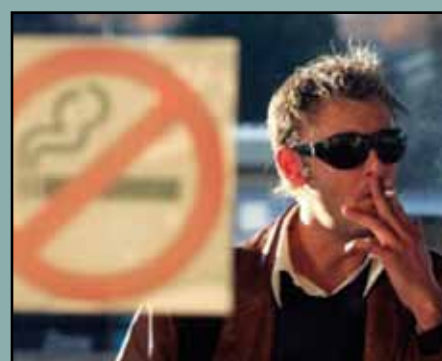
Incumplir algo, mejor que incumplir con algo

La palabra presidenta está registrada en el Diccionario académico y es una forma válida para aludir a las mujeres que ocupan ese cargo. En las noticias sobre la vuelta al trabajo de la presidenta argentina y sobre las elecciones presidenciales en Chile, se pueden encontrar las formas presidenta y presidente para aludir a las mujeres que ocupan o han ocupado estos puestos, como en «La presidenta retoma sus actividades con alto nivel de aprobación» o «Confía en que la expresidente Bachelet cambiará las cosas». Dado que la mayoría de las palabras que han añadido el sufijo -nte son comunes en cuanto al género (como el donante y la donante , del verbo donar ), a menudo se plantea la duda de si sucede lo mismo en el caso de presidente y ha de ser siempre la presidenta cuando alude a una mujer. Sin embargo, la Gramática académica explica que la voz presidenta es un femenino válido en el que se ha cambiado la e final por a , al igual que ocurre con asistente , dependiente o intendente . Puesto que, además, presidenta ya tiene registro académico desde el Diccionario de 1803 y se emplea desde mucho antes, no parece que haya motivo para no usar o incluso para no preferir esta forma cuando el referente es una mujer.