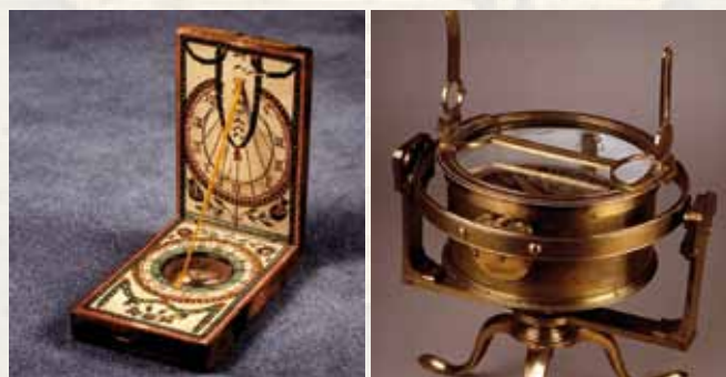
Posición: Exploración del Pacífico . Rumbo: Casa América . Longitud: Más de 170 piezas originales . Profundidad: 500 años de historia .

Ubicada la posición, descrito el rumbo, calculada la longitud y medida la profundidad... Tan solo queda llevar anclas... y así navegar sin miedo a lo largo de nuestra historia.